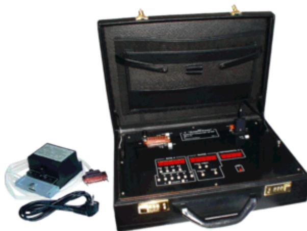
Рисунок 1 - Общий вид установки поверочной ЦУ 854

Фотографии общего вида, места нанесения клейм показаны на рисунках 1- 3.