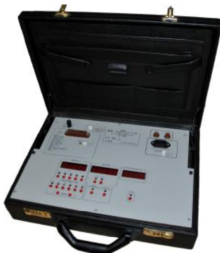
Рисунок 1 – Общий вид установки поверочной ЦУ 854.

Схема пломбировки от несанкционированного доступа, обозначение места нанесения знака поверки представлены на рисунке 2.