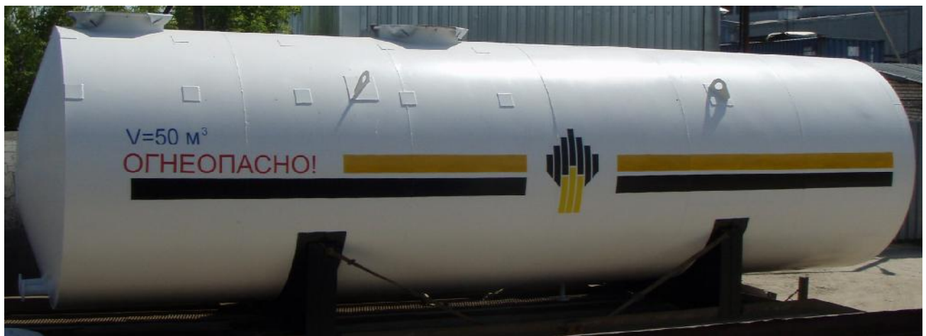
Фото 1. Общий вид резервуара стального горизонтального СМК

На фото 1 приведен общий вид резервуара стального горизонтального СМК.