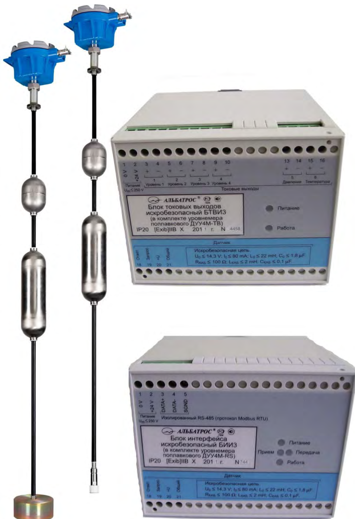
Фотография общего вида