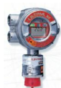
б) Ultima XE