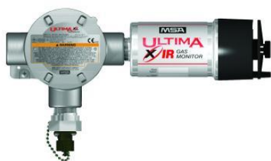
a) Ultima XIR