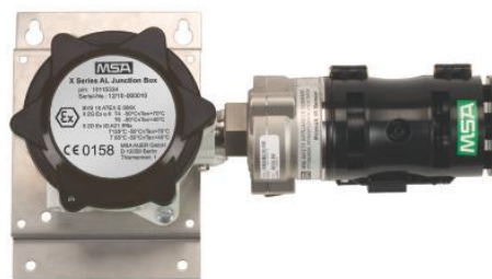
з) PrimaX IR