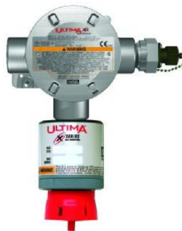
е) ULTIMA XL