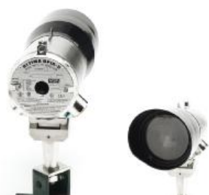
ж) ULTIMA OPIR-5