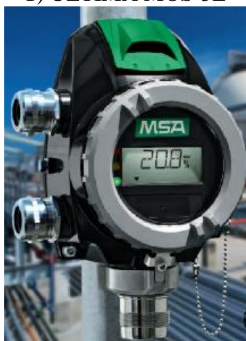
д) PrimaX P, PrimaX I