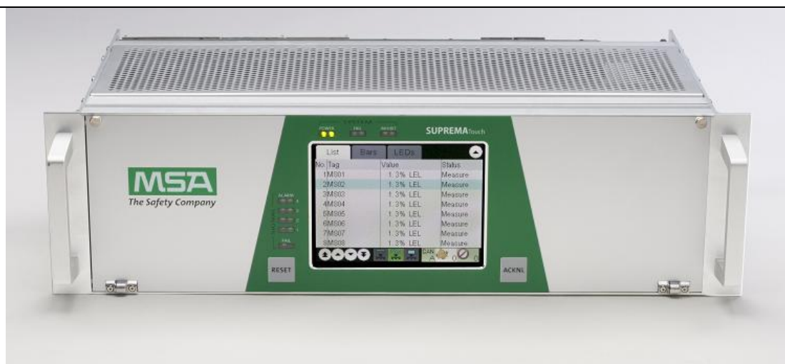
б) SUPREMA Touch