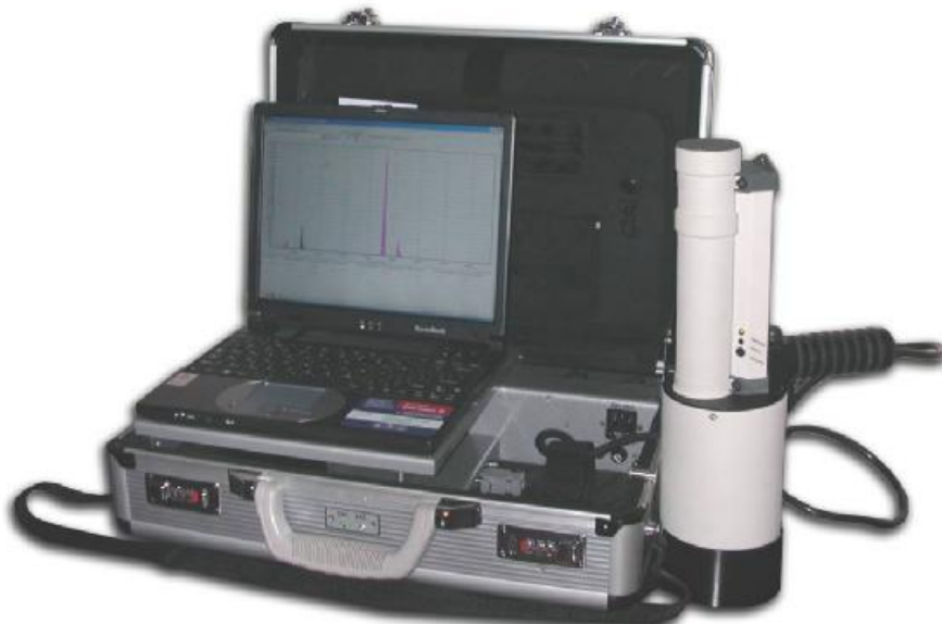
Рисунок 1 - Внешний вид анализатора «Призма - М(Au)» в переносном исполнении

Внешний вид анализатора «Призма - М(Au)» представлен на рисунках 1 и 2.