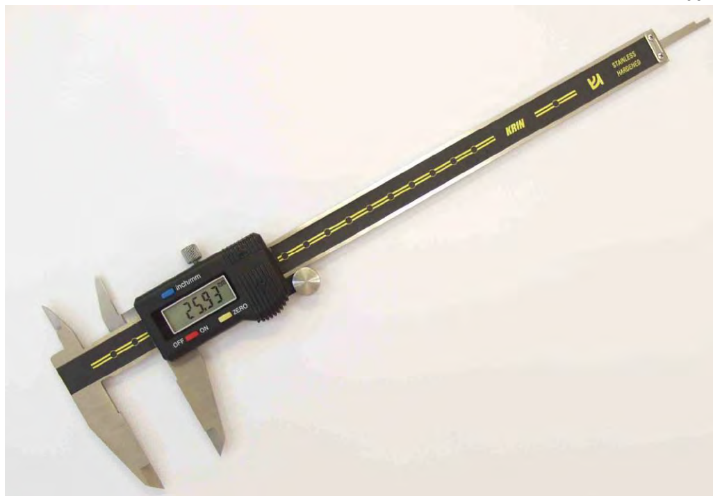
Штангенциркуль ШЦЦ с цифровым отсчетным устройством типа I