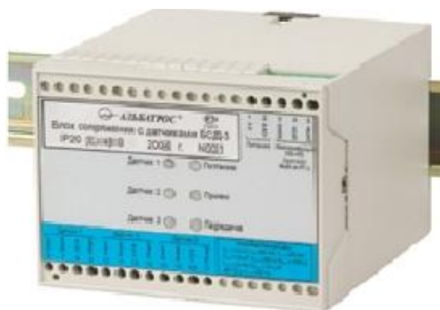
Рис.2 Фото вторичного преобразователя (БСД)

Схема пломбировки датчиков температуры представлена на рисунке 3.