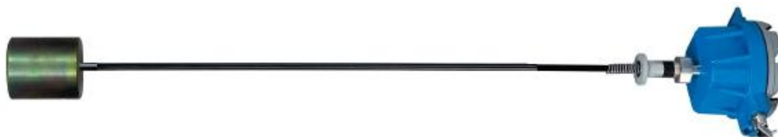
Рис.1 Фото первичного преобразователя с ЧЭ в сборе

Фотографии общего вида датчиков температуры многоточечных ДТМ2 представлены на рисунках 1-2