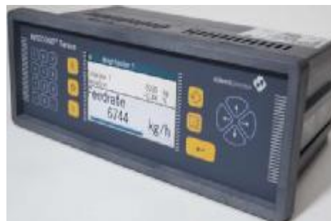
Рисунок 2 – Терминал INTECONT Tersus