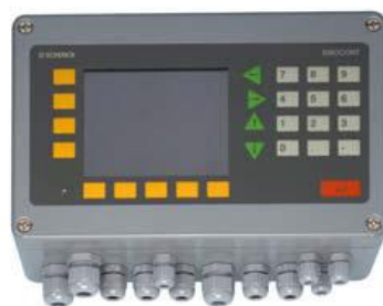
Рисунок 3 – Терминал DISOCONT