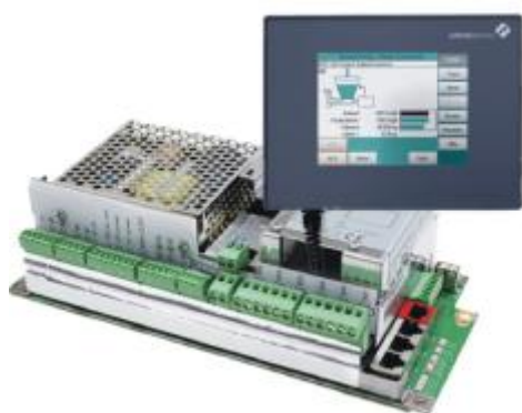
Рисунок 1 – Терминал DISOCONT Tersus

Общий вид терминалов и модификаций дозаторов представлен на рисунках 1 - 5 соответственно.