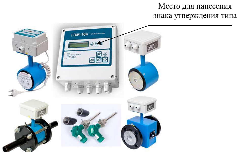
Рисунок 1- Внешний вид теплосчетчика с максимально возможным числом измерительных каналов (исполнение ТЭМ-104-4)

Внешний вид теплосчетчика приведен на рисунках 1 и 2.