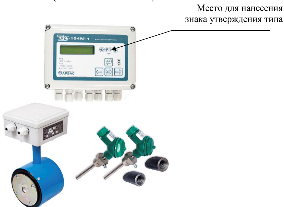
Рисунок 2- Внешний вид теплосчетчика (исполнение ТЭМ-104М-1)

Схема пломбировки теплосчетчика для защиты от несанкционированного доступа с указанием мест для нанесения оттиска поверительного клейма и поверительного клейма-наклейки приведена на рисунке 3.