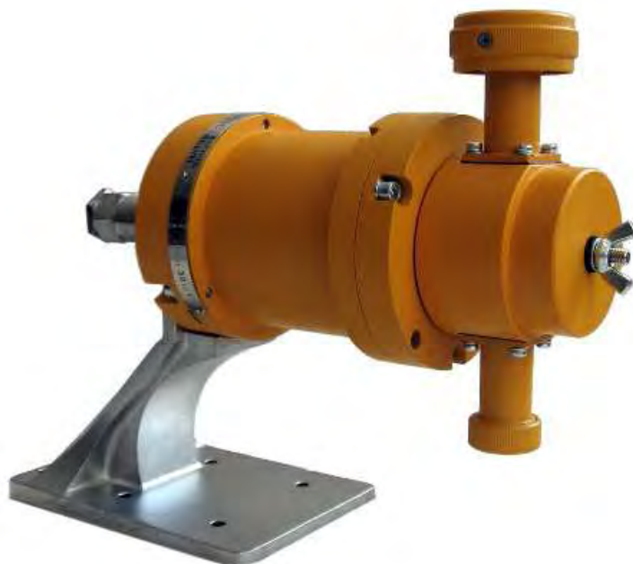
Рисунок 1 – Газоанализаторы СГОЭС, внешний вид (без блока отображения информации)