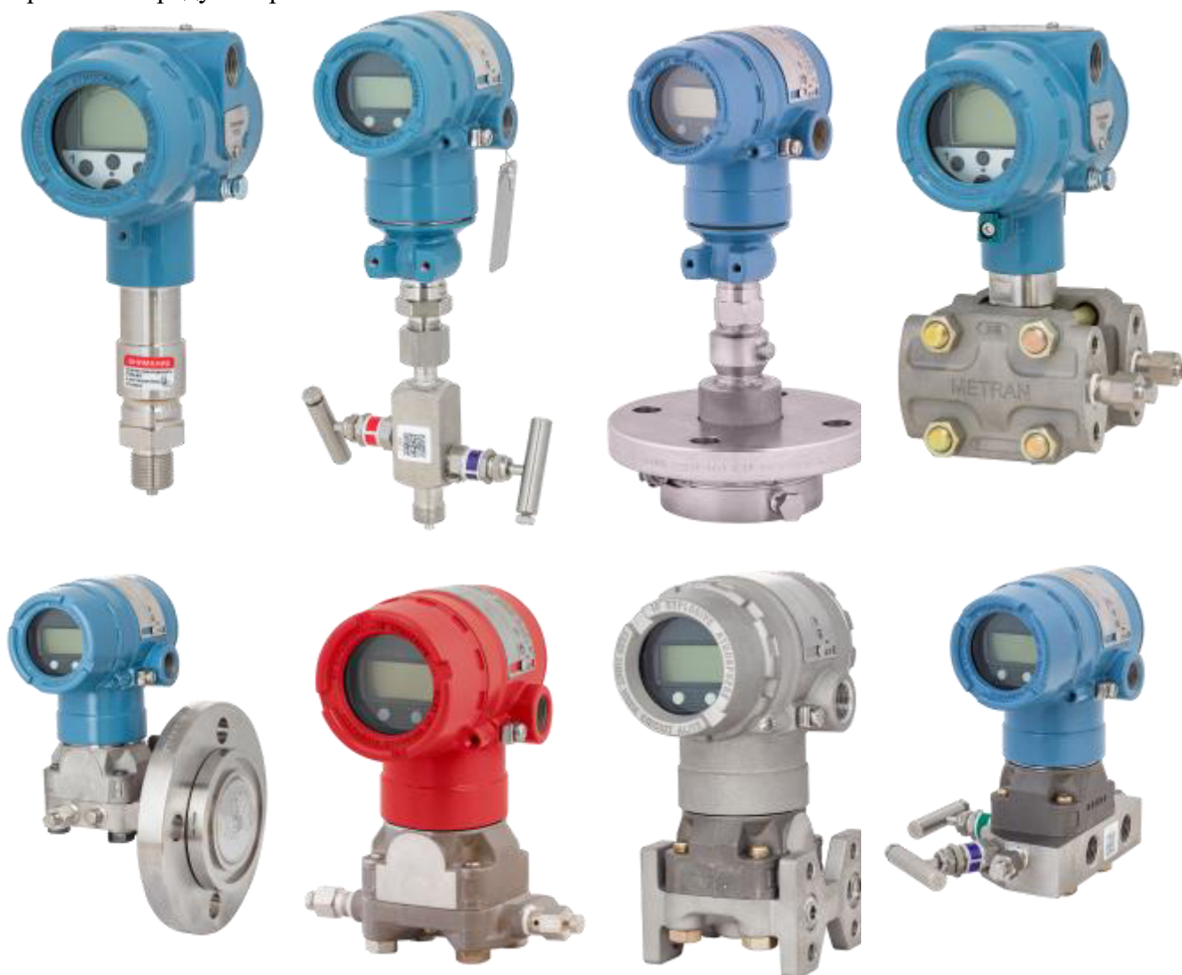
Рисунок 1 – Общий вид датчиков

Пломбирование датчиков не предусмотрено. Нанесение знака поверки на средство измерений не предусмотрено.