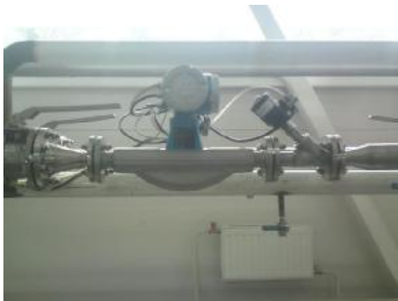
Фото 1. Расходомер Promass и клапан