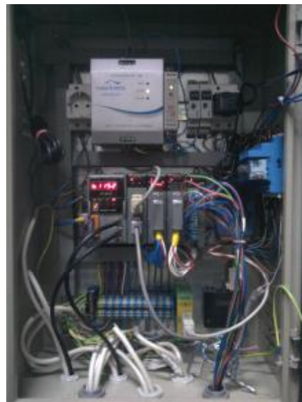
Фото 3 и 4. Шкаф УСПД