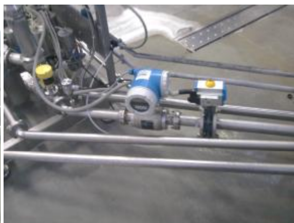
Фото 2. Расходомер Promag и дисковый затвор