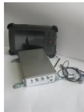
УСД-60-8К-ВФ с ПК