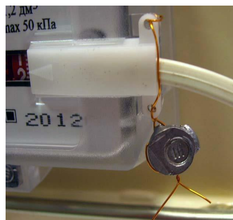
Рисунок 4 Схема пломбировки датчика импульсов