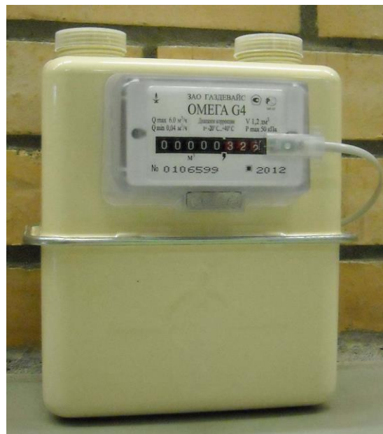
Рисунок 2 Общий вид счетчика с датчиком импульсов