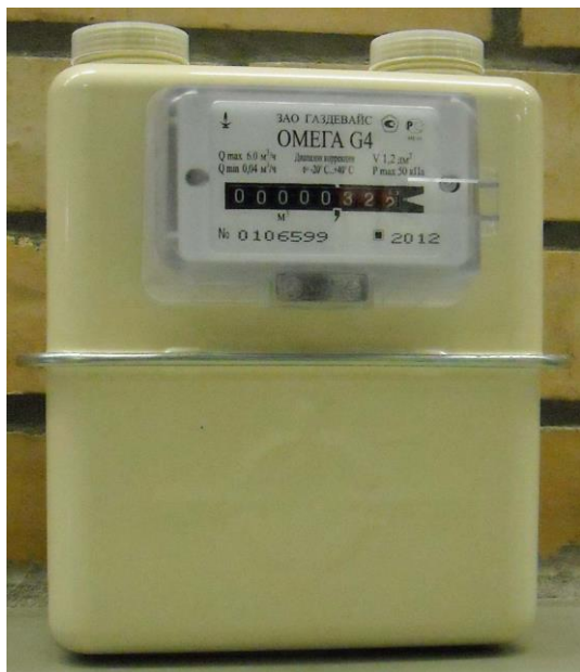
Рисунок 1 Общий вид счетчика.

Датчик импульсов представляет собой электронное устройство с магниторезистором для формирования импульсов, в момент прохождения магнитного поля магнита, закрепленного на первичном барабане сумматора. Количество выходных сигналов датчика импульсов пропорционально объему газа, прошедшего через счетчик. После установки в счетчик, датчик импульсов пломбируется в месте подключения организацией по эксплуатации газового хозяйства. Схема пломбировки датчика импульсов представлена на рис. 4.