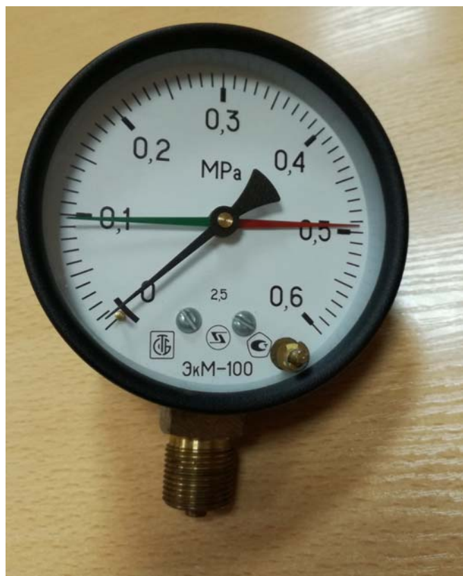
Рисунок 1 - Общий вид манометров ЭкМ, вакуумметров ЭкВ, мановакуумметров ЭкМВ показывающих сигнализирующих