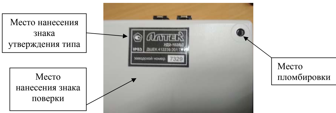
Рисунок 2 - Место нанесения знака утверждения типа, знака поверки и пломбировки дефектоскопа