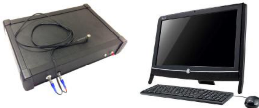
Рисунок 1 – Общий вид толщиномеров

Конструктивно толщиномеры состоят из электронного блока, ультразвукового преобразователя с номинальными частотами от 0,5 до 15 МГц, персонального компьютера, на который устанавливается программное обеспечение (ПО). Фотография общего вида толщиномеров представлена на рисунке 1.