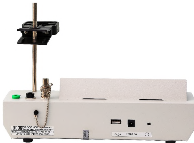
Рисунок 2 - Схема пломбировки от несанкционированного доступа