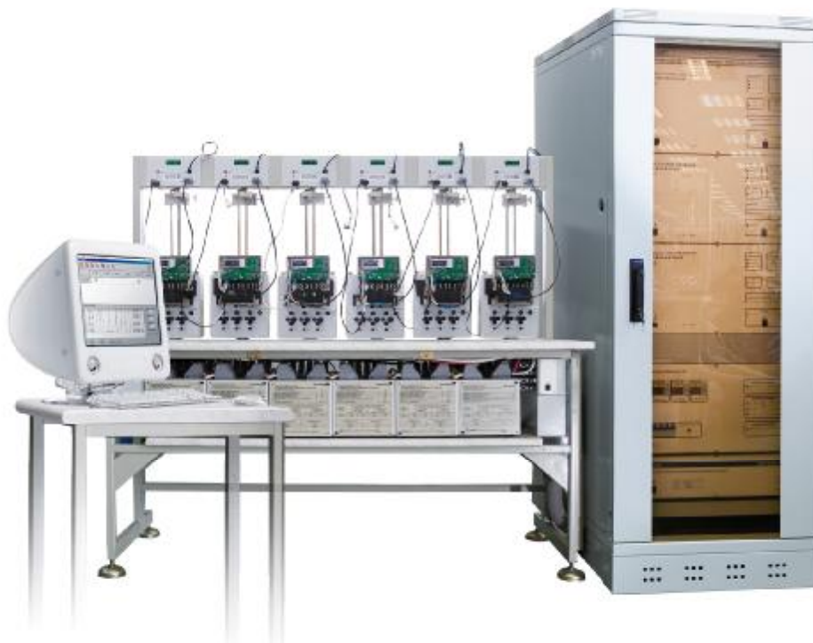
Рисунок 2 – Установка СУ201 с одним стендом