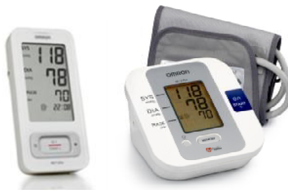
Рисунок 1 – Общий вид ИАД автоматических, для измерений на плече

Общая схема пломбировки и маркировки – на рисунке 5.