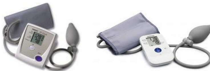
Рисунок 2 – Общий вид ИАД полуавтоматических, для измерений на плече