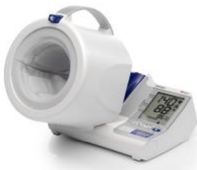
Рисунок 4 – Общий вид ИАД с автоматическим поддержанием скорости снижения давления в манжете (исполнение I-Q132)