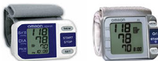
Рисунок 3 – Общий вид ИАД автоматических, для измерений на запястье