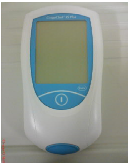
Рисунок 2 – Коагулометр портативный CoaguChek XS Plus