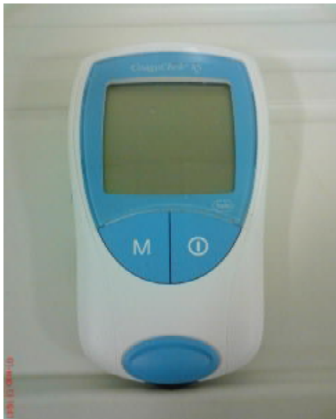
Рисунок 1 – Коагулометр портативный CoaguChek XS