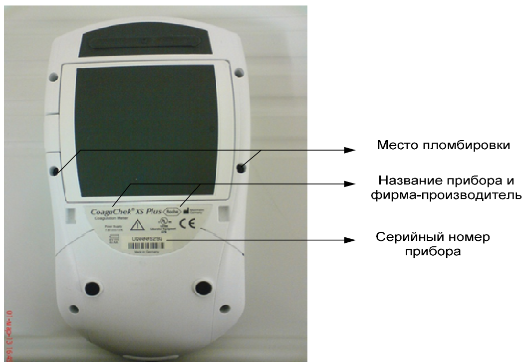
Рисунок 4 – Схема маркировки и пломбировки коагулометра портативного CoaguChek XS Plus