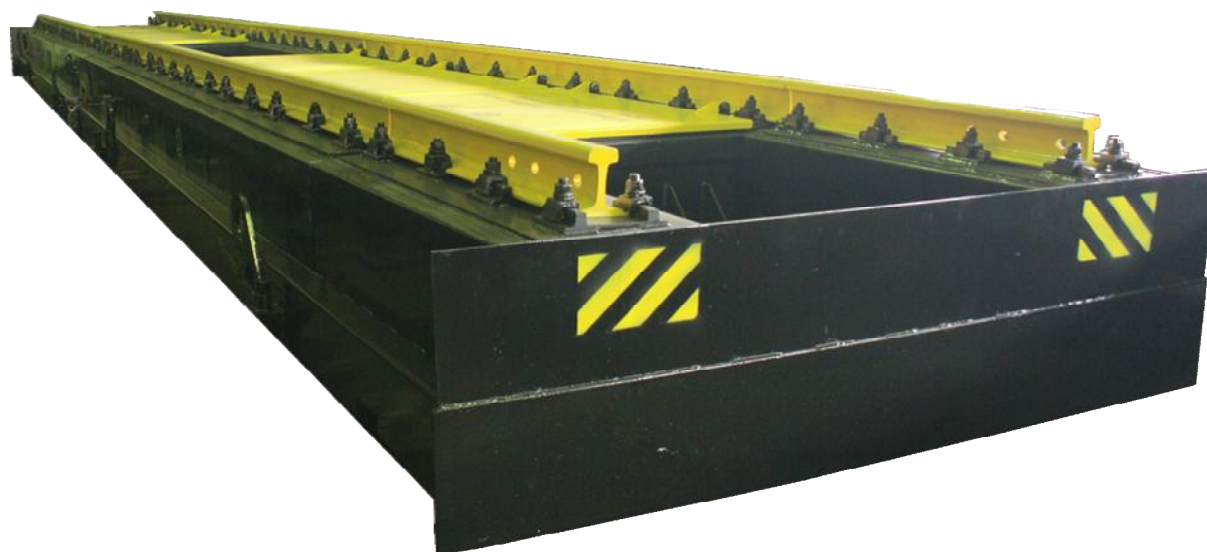
Рисунок 1 – Пример общего вида весов