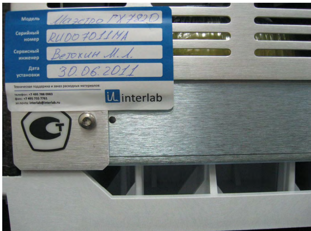
Рисунок 3. Место пломбирования для защиты от несанкционированного доступа