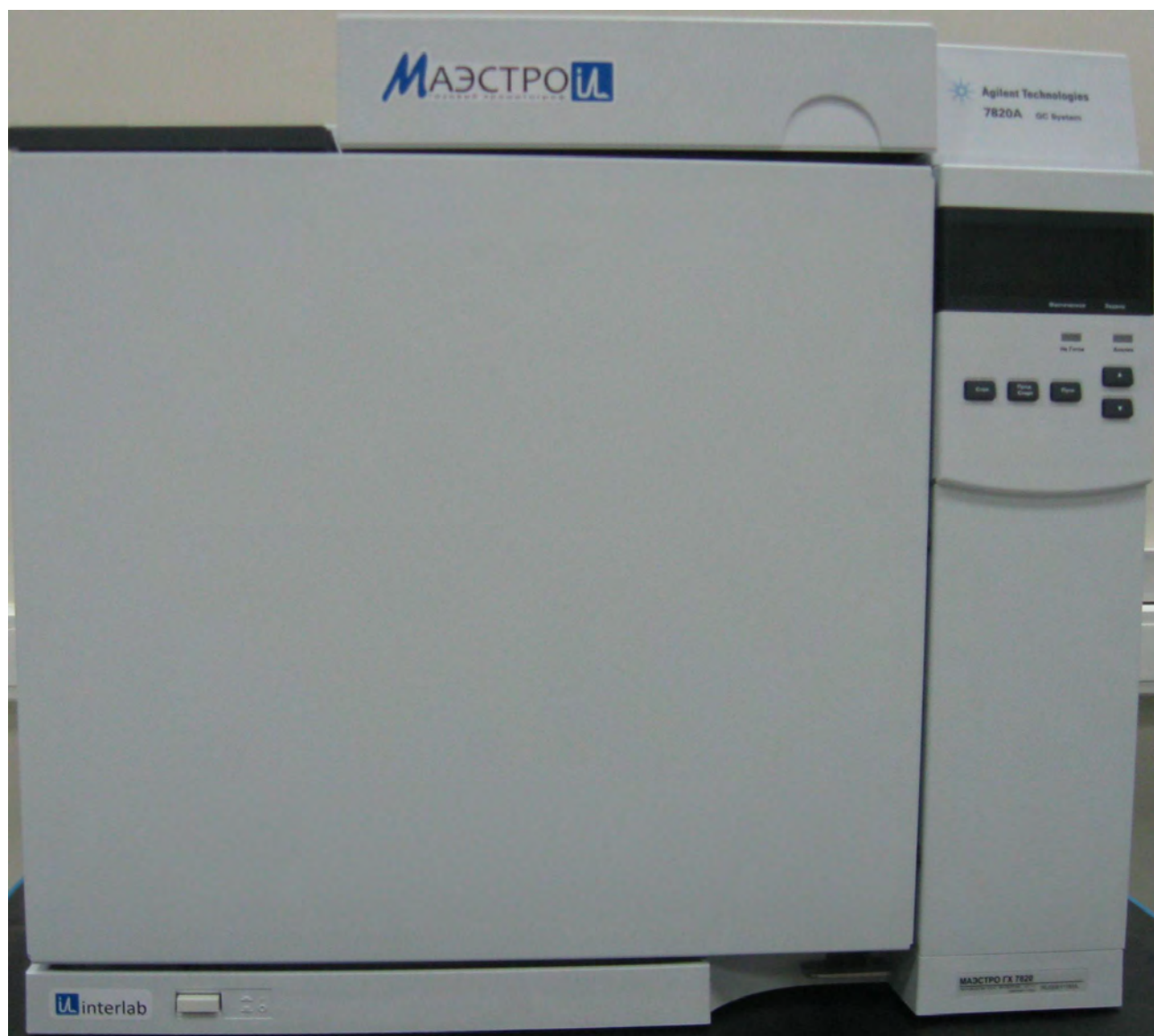
Рисунок 1. Общий вид хроматографа газового "Маэстро GX 7820"