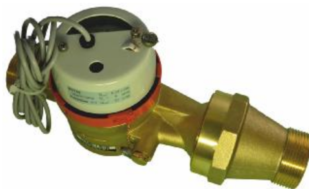
б) DN 25-40