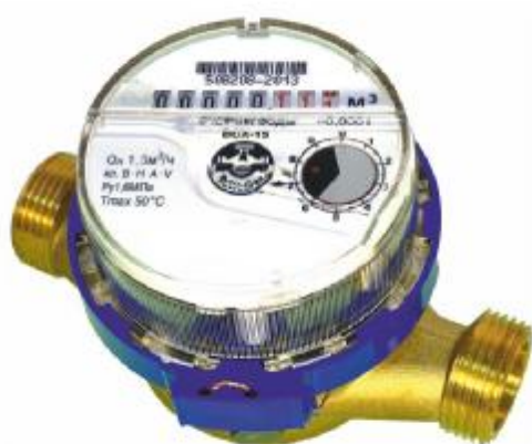
а) DN 15-20

Счетчики могут устанавливаться в горизонтальных и вертикальных трубопроводах.