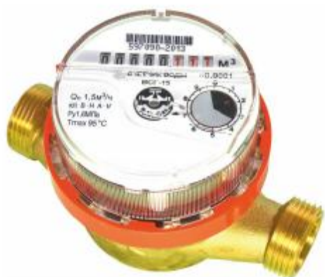
а) DN 15-20