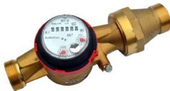
б) DN 25-40