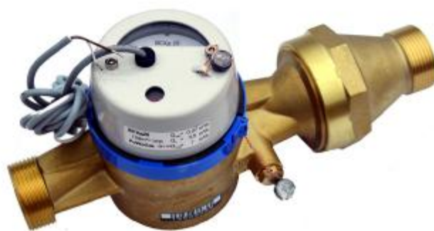
б) DN 25-40