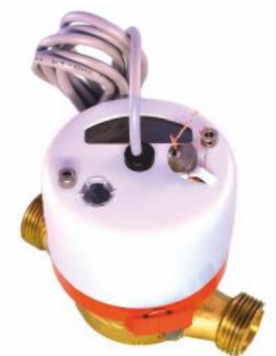
а) DN 15-20