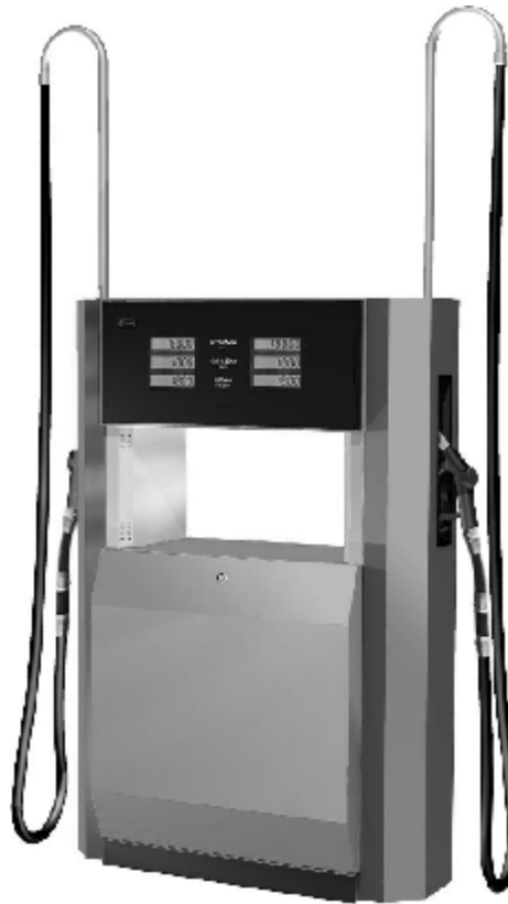
Рисунок 4 – Внешний вид модификаций "ТОПАЗ – 4XX"