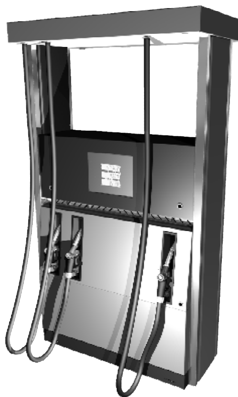
Рисунок 3 – Внешний вид модификаций "ТОПАЗ – 3XX"