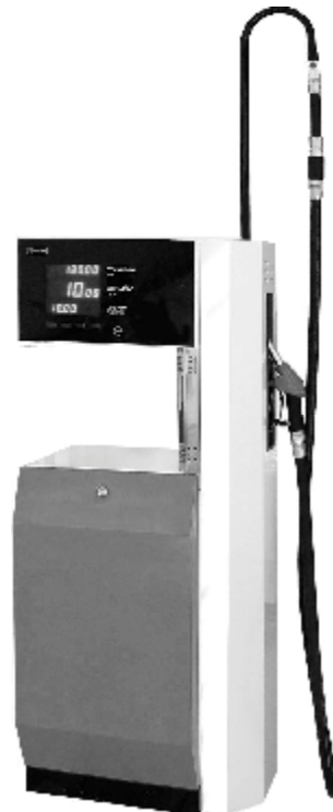
Рисунок 1 – Внешний вид модификаций "ТОПАЗ – 11X"

Общий вид модификаций колонок представлен на рисунках 1 – 6.