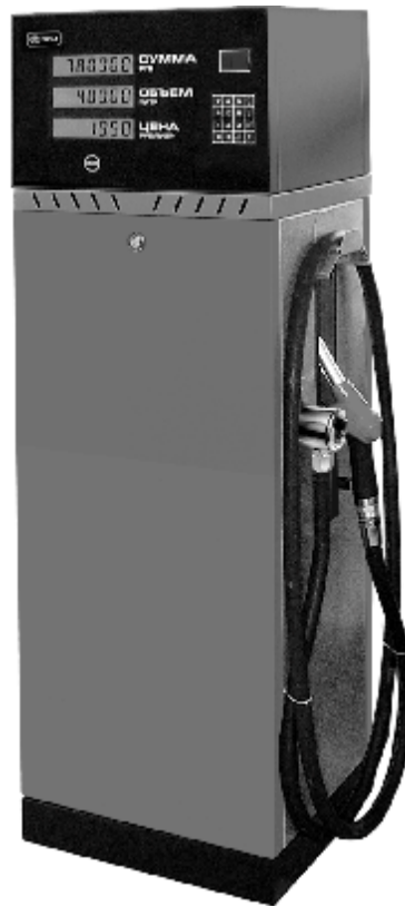
Рисунок 6 – Внешний вид модификаций "ТОПАЗ – 61X"

В колонках предусмотрено опломбирование генератора импульсов, блока управления, измерителя объёма, как сборочных единиц колонки, влияющих на метрологические показатели, которые должны быть опломбированы представителем Федерального агентства по техническому регулированию и метрологии после проверки метрологических характеристик по техническим условиям ТУ 4213-001-53540133-2009.