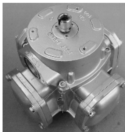
Рисунок 9 – Пломбировка измерителя объема