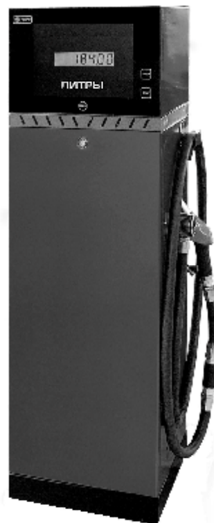
Рисунок 5 – Внешний вид модификаций "ТОПАЗ – 51X"