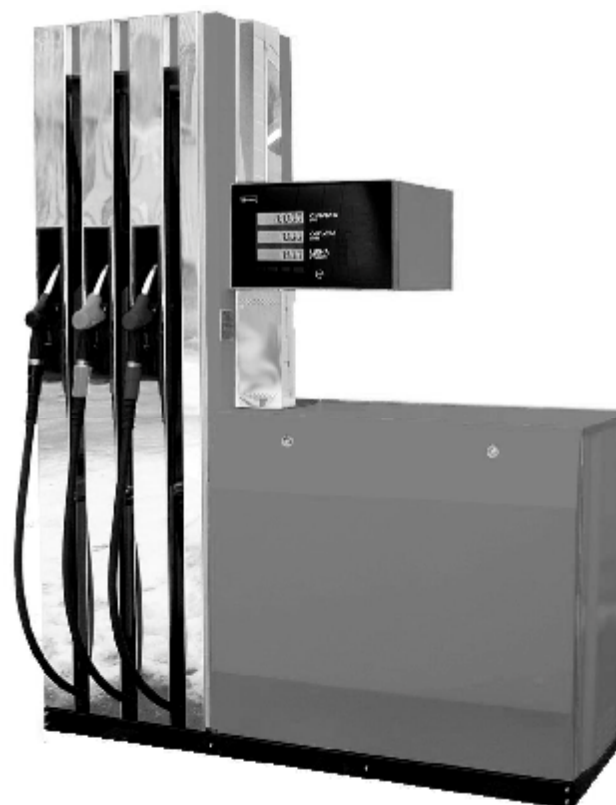
Рисунок 2 – Внешний вид модификаций "ТОПАЗ – 2XX"