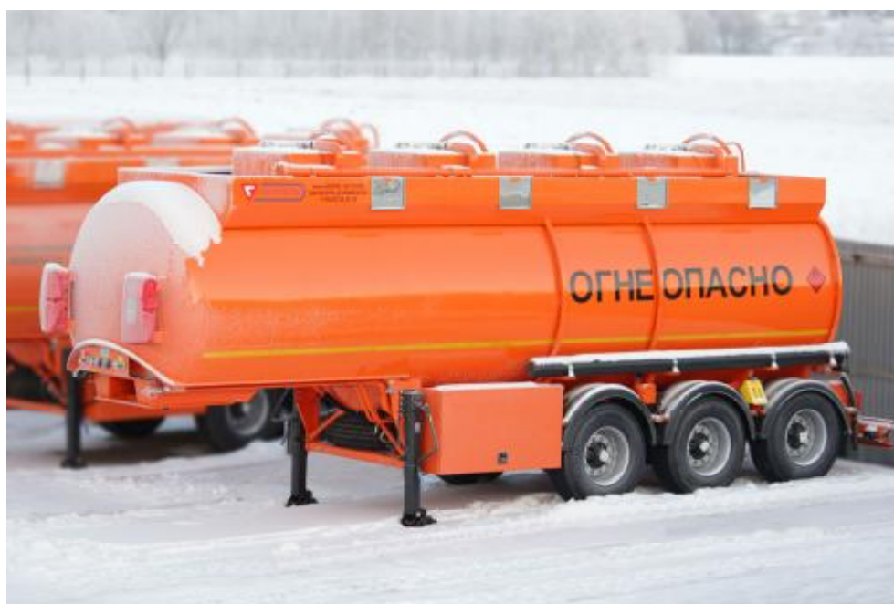
Рисунок 1 - Общий вид полуприцепов-цистерн

Место нахождения пломбы на крышке заливной горловины и на кране от донных клапанов см. рисунок 2, количество мест в зависимости от количества отсеков.