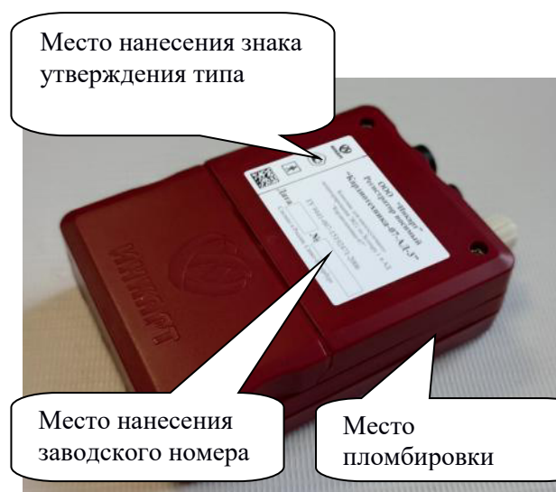
а) «Кардиотехника-07- 3Р», «Кардиотехника-07-3/12Р», «Кардиотехника-07-АД-1», «Кардиотехника-07-АД-3»