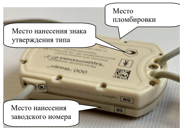
г) «Кардиотехника-07- 3»