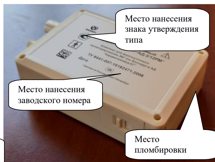
б) «Кардиотехника-07-АД-3/12Р», «Кардиотехника-07-АД-3/12РМ»