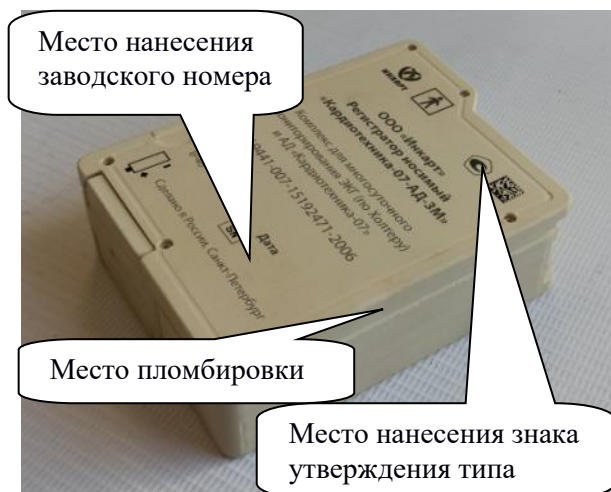
ж) «Кардиотехника-07-АД-1М» «Кардиотехника-07-АД-3М»