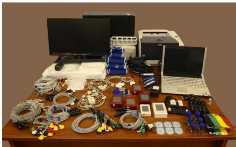
Рисунок 1 – Общий вид комплексов для многосуточного мониторинга ЭКГ (по Холтеру) и АД «Кардиотехника-07»