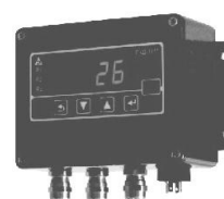
в) настенный 2155 — ПКД-1115