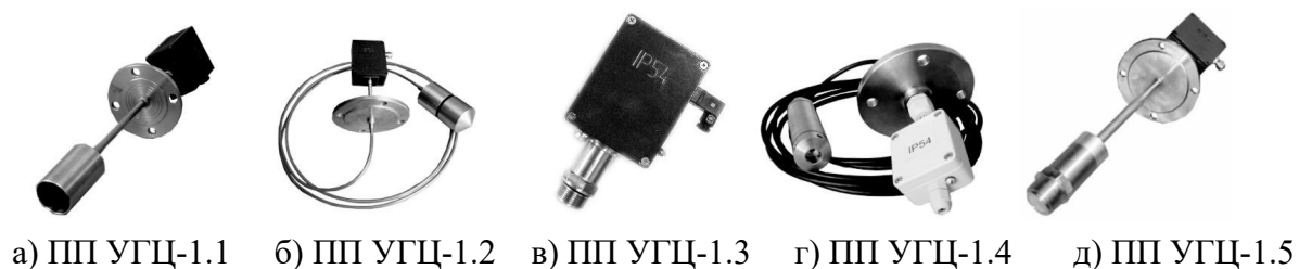
Рисунок 5 – Модель 2170 - передающий преобразователь (ПП) измерителя гидростатического давления цифрового УГЦ-1(-Ex).