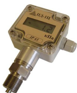
а) 2135 — ПД-1Ц