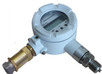
в) 2135 — ПД-1Ц.В