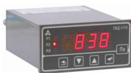
б) щитовой 2150 — ПКД-1105