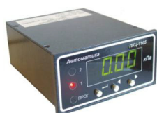
а) 2140 — ПКД-1104