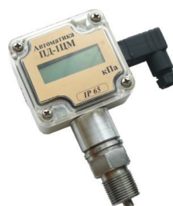
б) 2136 — ПД-1ЦМ