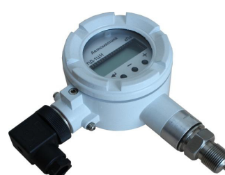
г) 2136 — ПД-1ЦМ.В