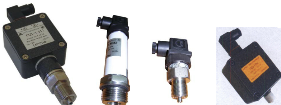
а) 2110 — ПД-1.И(.В) б) 2120 — ПД-1М.И(.В,.Н,.Т,.ТН) в) 2130 — ПД-1.Т(.Н,.ТН)