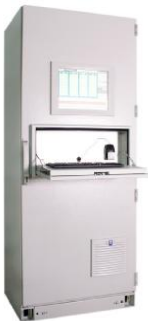
Рисунок 2 - Внешний вид системы информационно-измерительной расширенного вибромониторинга «ТИК-RVM»

Внешний вид системы информационно-измерительной расширенного вибромониторинга «ТИК-RVM» приведен на рисунке 2.