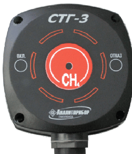
Рисунок 1 - Внешний вид сигнализатора

Схема пломбировки от несанкционированного доступа приведена на рисунке 2.