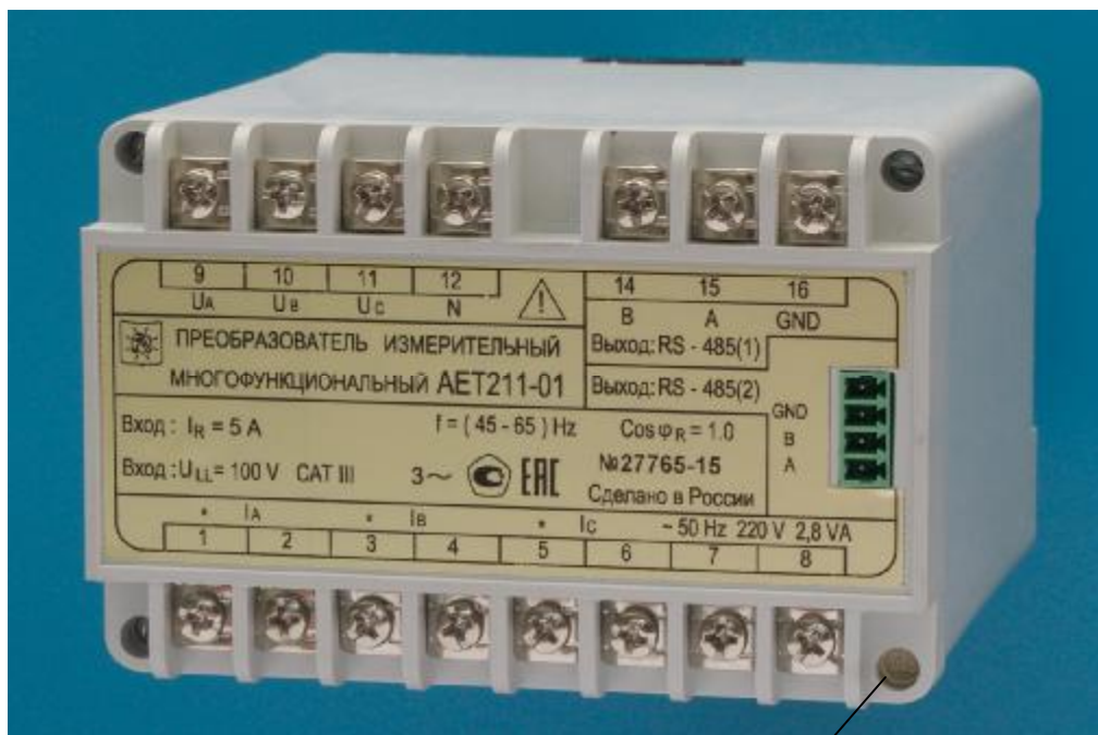
Рисунок 1 – Преобразователь серии АЕТ100 стандартного исполнения с двумя интерфейсами RS-485