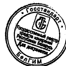
Рисунок А.1 – Место нанесения знака поверки (клеймо-наклейка) на секундомер

место нанесения знака поверки (клеймо- наклейка)