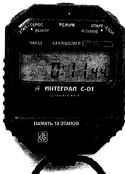
Рисунок 1 – Внешний вид секундомера