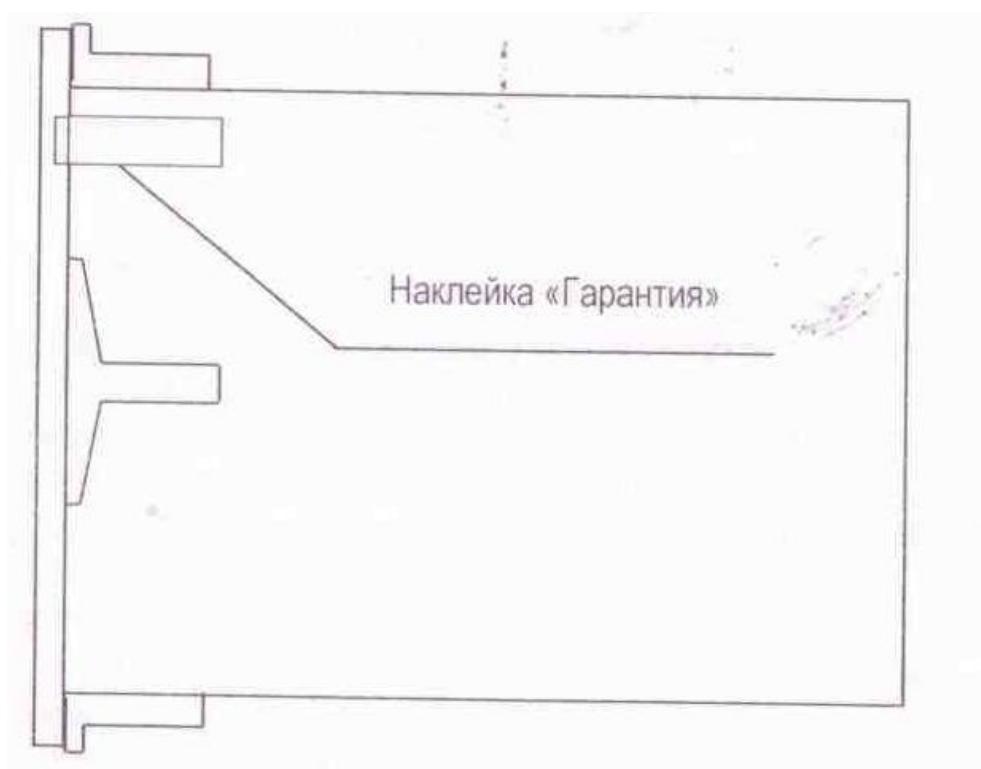
Рисунок 3 – Схема пломбировки от несанкционированного доступа