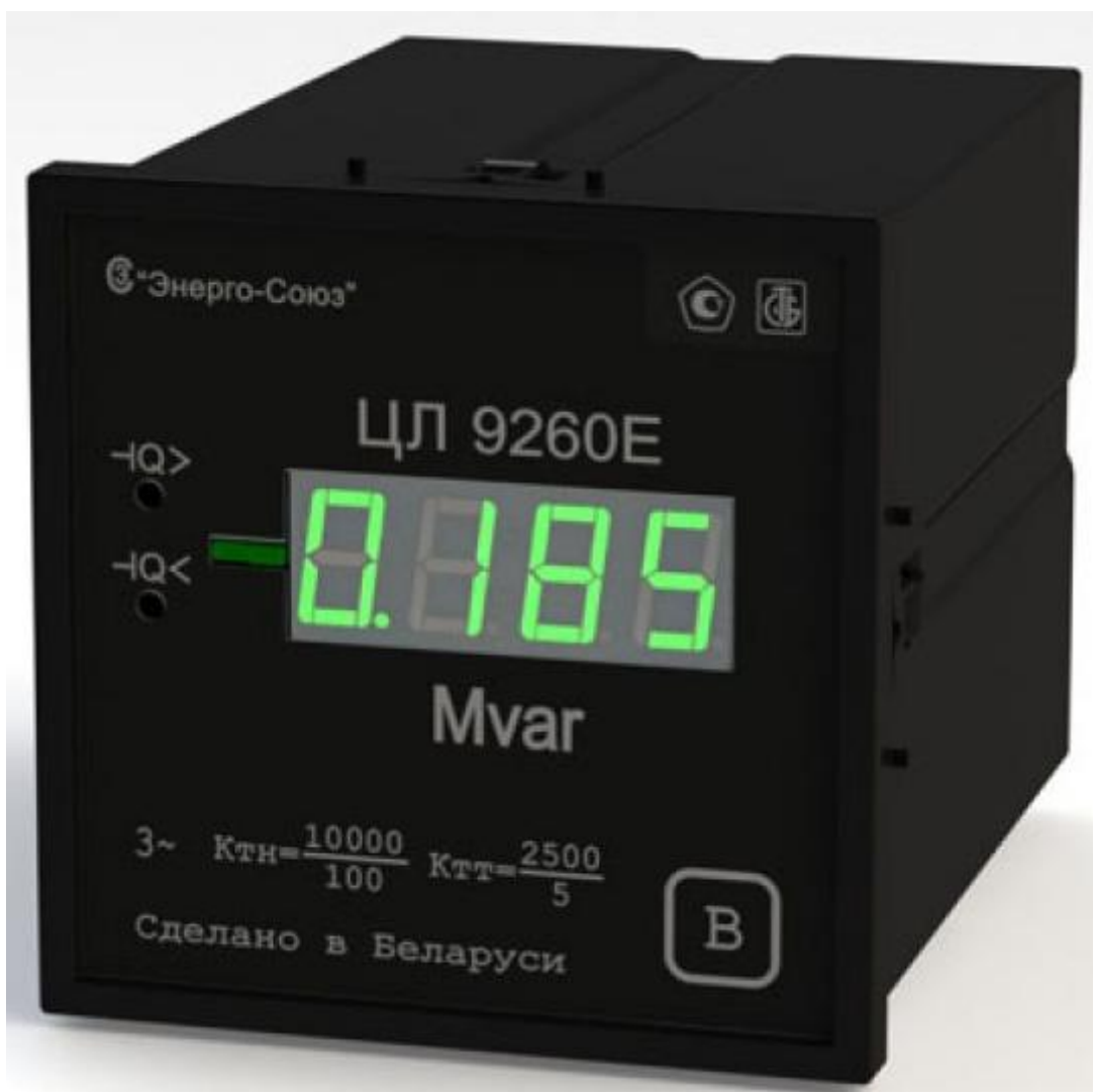
Рисунок 1 – Фотография общего вида преобразователя ЦЛ 9260