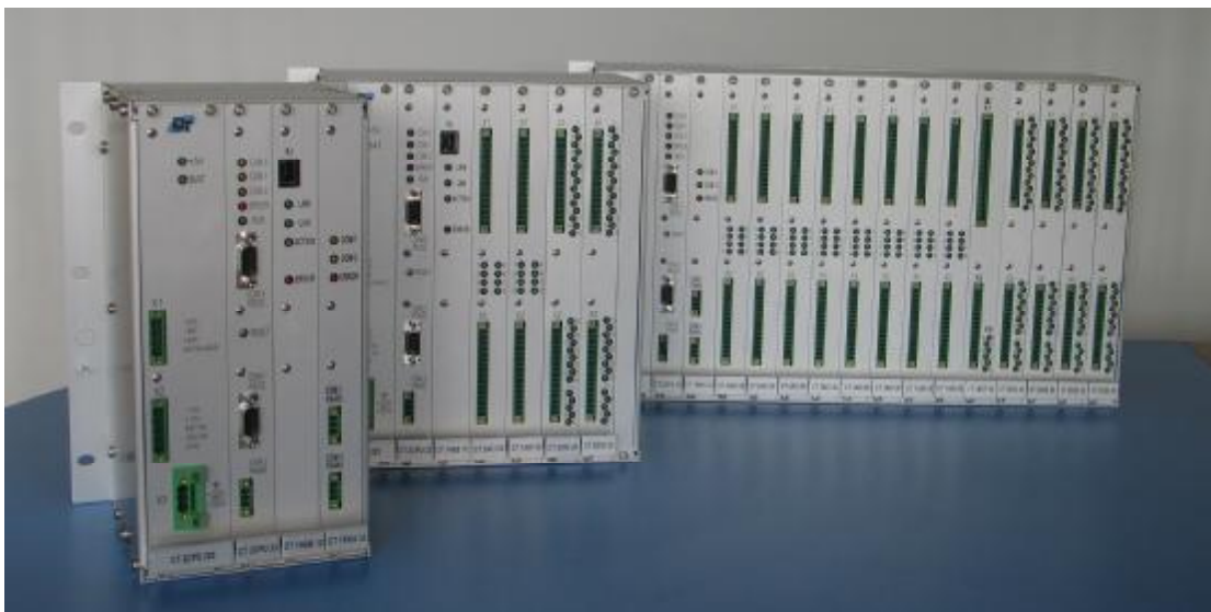
Рисунок 1 - Общий вид контроллеров КСА-02

Контроллеры предназначены для использования вне взрывоопасных зон промышленных объектов. Связь с электротехническими устройствами и датчиками, установленными во взрывоопасных зонах, осуществляется через искробезопасные цепи.