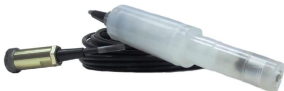
б - Датчик кислородный ДК-409