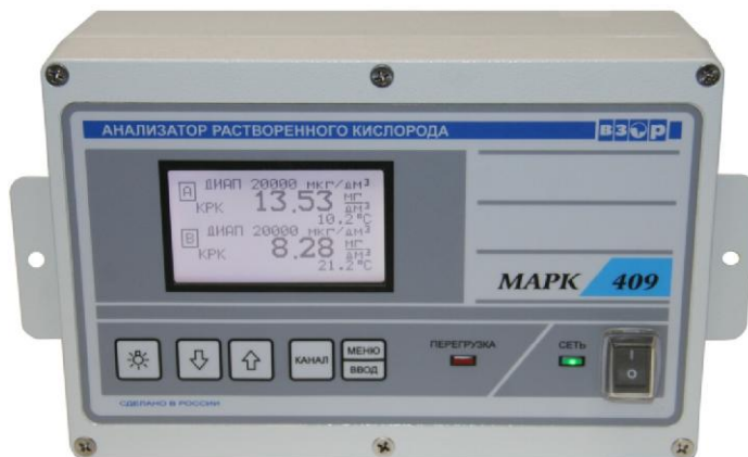
а - Блок преобразовательный