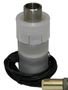
в - Датчик кислородный ДК-409Т (ДК-409ТМ)