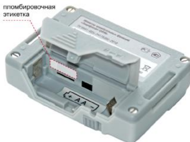
Рисунок 2 – Место установки пломбировочной этикетки

От несанкционированного доступа автономный блок пациента АБП-5 защищен пломбой, устанавливаемой в аккумуляторном отсеке, в соответствии с рисунком 2.