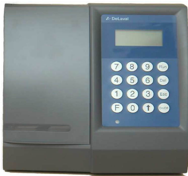
Рис. 1. Внешний вид анализатора DCC

Анализаторы соматических клеток в молоке DCC представляют собой портативные переносные лабораторные приборы автономным питанием от батареи. Внешний вид анализатора приведен на рисунке 1.