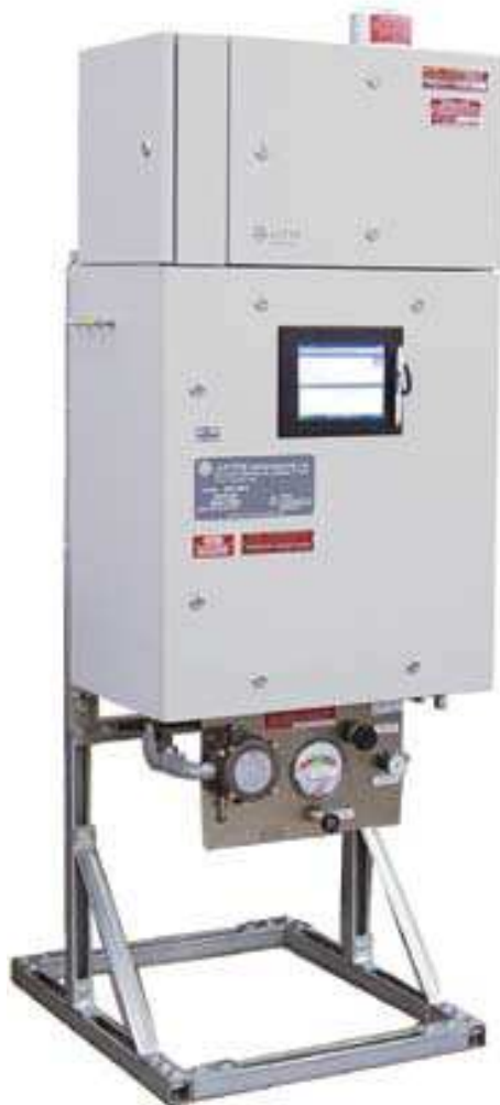
Рисунок 1 – Внешний вид анализатора

Внешний вид анализатора представлен на рисунке 1.