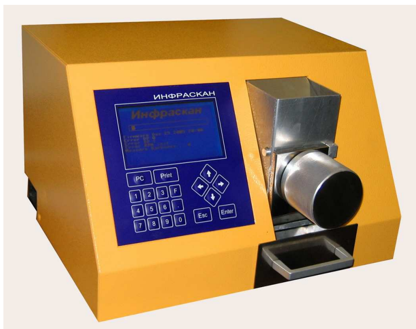
Рис.1 Анализатор модели ИНФРАСКАН-105.

Внешний вид анализатора модели ИНФРАСКАН-105 показан на рисунке 1.