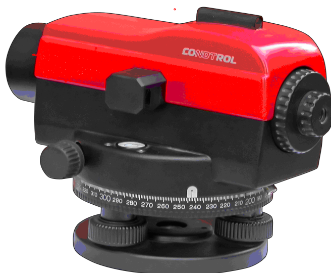
Общий вид нивелира

По заявленным параметрам нивелиры соответствуют требованиям ГОСТ 10528-90, предъявляемым к группе технических нивелиров.