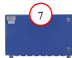
Мультиадаптер PP 4100 AT

Цифрами на фотографиях компонентов комплекса обозначены места их аппаратной защиты от несанкционированного вскрытия (пломбы и наклейки).