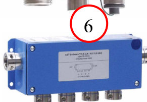
Адаптер PP 4100 AT