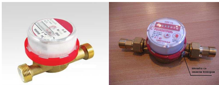
Рисунок 1 – Фото общего вида с указанием места пломбирования