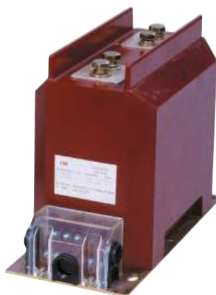
Рис. 1 - Фотография общего вида трансформаторов тока ТРУ 40.13.

Принцип действия трансформаторов тока заключается в преобразовании переменного тока промышленной частоты в переменный ток для измерения с помощью стандартных измерительных приборов, а также обеспечении гальванического разделения измерительных приборов от цепи высокого напряжения.