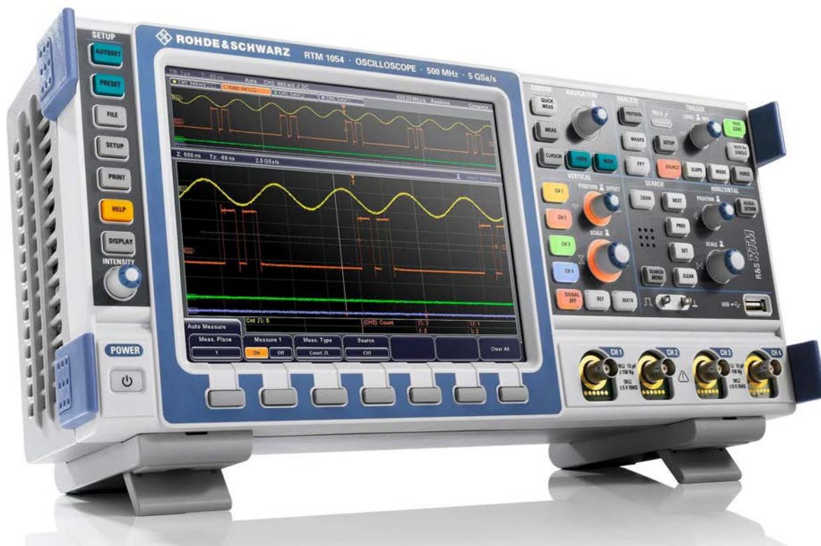
Рисунок 1 - Внешний вид осциллографа