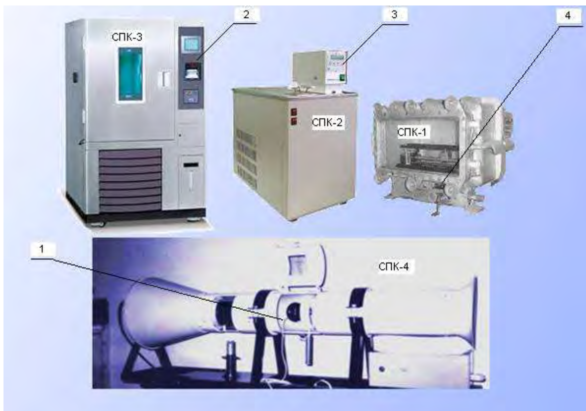
Рис. 2 Фотография общего вида СПЛ – 1 и места пломбирования составных частей СПК – 1, СПК – 2, СПК – 3 и СПК – 4 (отмечены выносками 1–4)