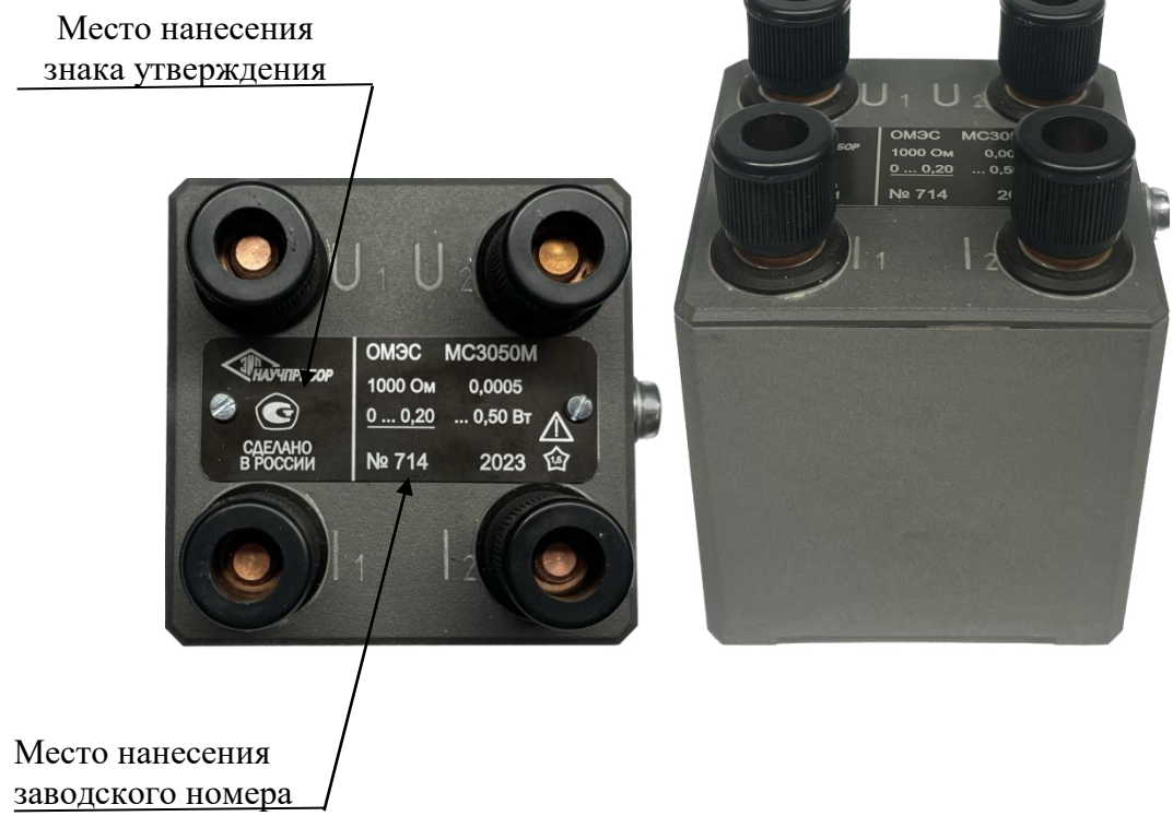
Рисунок 2 – Общий вид МС3050М-2