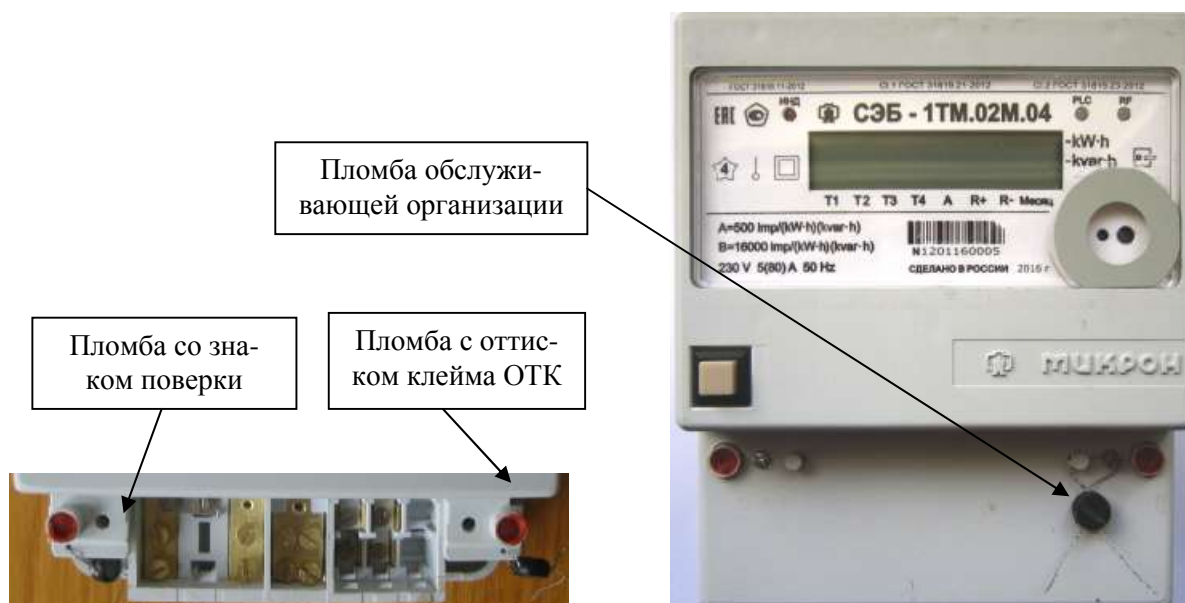
Рисунок 1 - Внешний вид счетчиков, предназначенных для установки внутри помещения, и схема пломбирования

Внешний вид счетчиков, предназначенных для установки внутри помещения (таблица 1), и схема пломбирования приведены на рисунке 1.