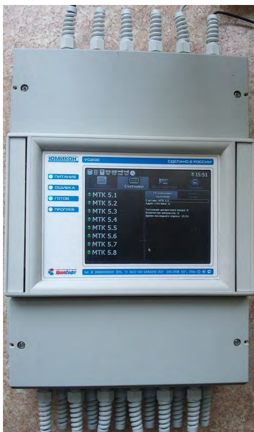
МЕСТА УСТАНОВКИ ПЛОМБ