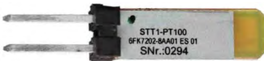
Рис. 2 - вид снизу